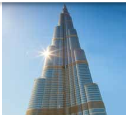
PLUS LOIN DANS L'EXCELLENCE