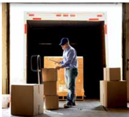
VITESSE DE COMMERCIALISATION