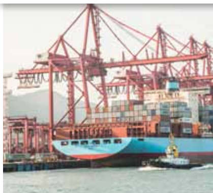
SANTÉ ET SÉCURITÉ AU TRAVAIL