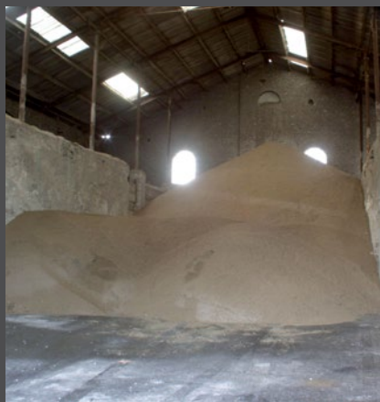
CASE DE STOCK EN VRAC