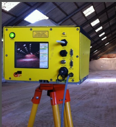
PRISE DES MESURES

Notre scanner laser 3D portable à très longue portée de numérisation est associé à une fonction infrarouge sans réflecteur, ce qui en fait un outil idéal pour les environnements extérieurs comme intérieurs. Grâce à des impulsions laser nous pouvons mesurer la surface réelle de tout type de tas en vrac et ainsi connaître la quantité réelle de marchandise.